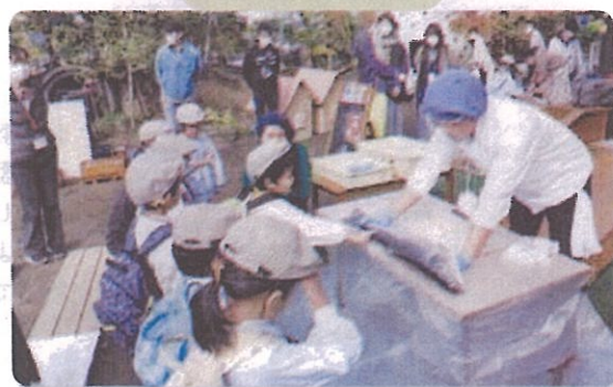
地域の方との交流